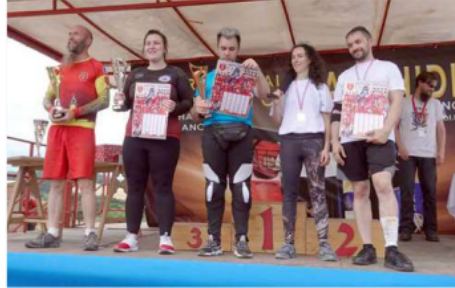
Podium avec : France, Pologne, Chypre, Israël.