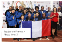
Équipe de France

Pour la première fois, Champeix organise les Championnats d'Europe les 10, 11 et 12 juin. « Habituellement, la compétition se déroule à Minsk en Biélorussie, compétition à laquelle on participe depuis 2017. Vu les événements et avec l'accord de la Fédération Internationale, on a rapatrié la compétition à l'ouest.