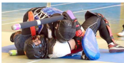
Mise à terre en combat de Profight.