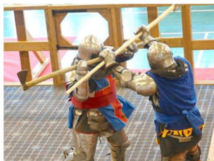
Combat de Béhourd en armure.

Le samedi soir sera plus festif avec un grand repas et un concert.