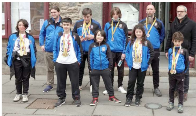
Les Champillauds à leur retour, tous bien fatigués mais heureux, en compagnie du maire.