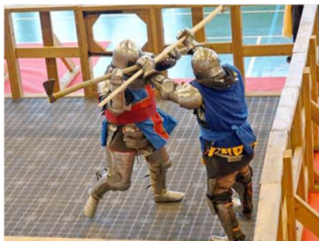
Combat de Béhour.

Les Écuyer du Marchidial enchaînent les animations telles les fêtes médiévales de Montferrand et de Murol et de plus travaillent depuis plusieurs semaines sur la fête du Marchidial qui aura lieu les 10 et 11 juin au gymnase et sur toute l'esplanade autour de ce dernier. Il s'agit en fait du Tournoi international, championnat d'Europe de Modern Sword Fighting.