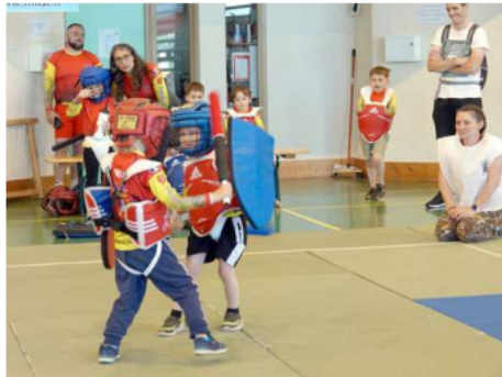
Les mini-poussins en compétition.

Le groupe An Féasog a offert un concert de folk irlandais pour finir la soirée en beauté.