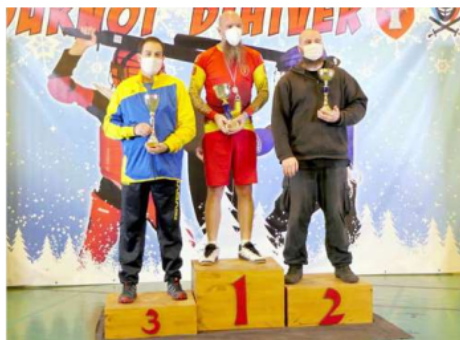
Remise des coupes aux trois premiers clubs.