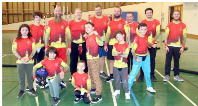
Tous fiers d'arborer leur beau tee-shirt...

Depuis la rentrée, ils cumulent 14 animations (dont 6 prestations), avec la mobilisation de 78 écuyers. Ils ont entre autres participé à la fête médiévale de Montferrand. Ils étaient présents sur les mercredis de Noël avec des